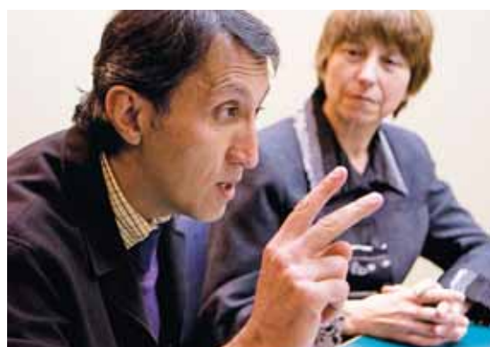
JACQUES NADEAU LE DEVOIR